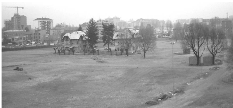
L'Ex-Ovocoltura, un vasto e importante spazio da non buttare via

Ma le aspettative dei cittadini, nonostante lo stanziamento miliardario, sono state tradite. Nella zona è infatti allo studio