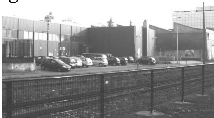
V. Gorki, aree dismesse: un altro boccone appetitoso per gli speculatori

Perché alla fine saranno loro a subire l'aumento del traffico e a veder morire il centro città sotto l'onda di nuove aree commerciali che vi si avvicinano sempre di più. Qualsiasi progetto di riqualificazione deve prevedere che le zone in questione siano, almeno per la maggior parte, destinate ad ospitare servizi pubblici. È impensabile che progetti dai guadagni milionari per il privato che costruisce portino al Comune di Cinisello Balsamo qualche