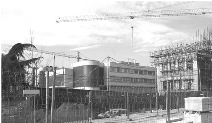
Da anni il Centro di Cinisello è soffocato da interminabili cantieri

(segue dalla prima) La costruzione di 8 palazzoni di 8 piani a due passi da Piazza Gramsci in cambio della nuova sede comunale. Cantieri in centro per almeno altri 5 anni, escludendo i probabili ritardi che nell'ultimo decennio si sono sempre verificati nelle grandi opere della Città.